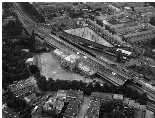
Maliebaan station 1927

De tentoonstelling is te bezoeken tot en met 6 juli 2019 in het Utrechts Archief, Hamburgerstraat 28 te Utrecht, geopend van dinsdag tot en met vrijdag van 10.00 – 17.00 uur en in het weekend van 12.30 – 17.00 uur. De toegang is gratis. Zie ook: www.hetutrechtsarchief.nl . (bron: NVBS)