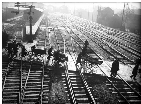
Vleutenseweg 1930

Uit de tijd dat er nog een glorieuze overkapping aanwezig was en het wegvervoer nog grotendeels uit geduwde en getrokken karren bestond!